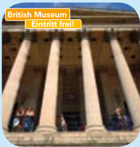
British Museum Eintritt frei!

LONDON FOR FREE – folgende Museen in London sind kostenlos: (bei Sonderausstellungen sind bestimmte Abschnitte kostenpflichtig): British Museum, Imperial War Museum, Victoria & Albert Museum, National Maritime Museum, Museum of London, Natural History Museum, Science Museum, Theatre Museum, Tate Gallery und Royal Observatory in Greenwich! Euer Reiseleiter gibt Euch gerne Anfahrtspläne, weitere Infos und Tipps.