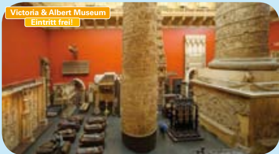
Victoria & Albert Museum Eintritt frei!