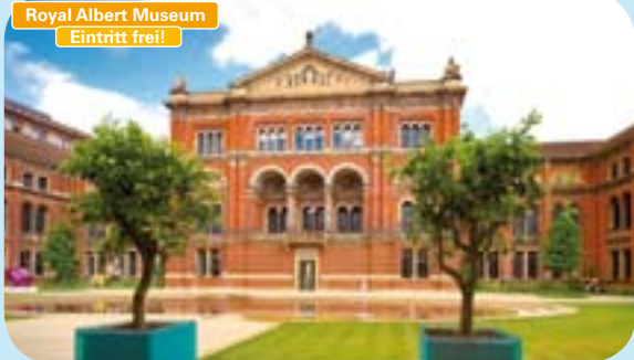
Royal Albert Museum Eintritt frei!