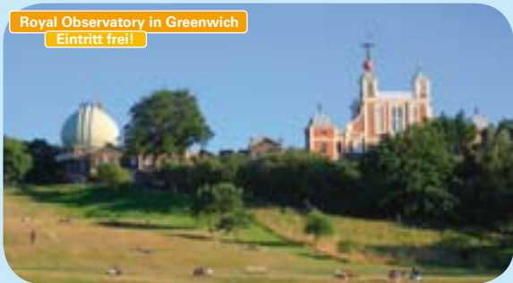
Royal Observatory in Greenwich Eintritt frei!