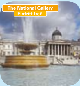
The National Gallery Eintritt frei!